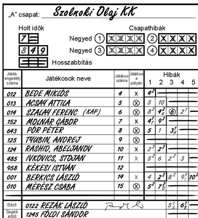
10. ábra A csapatok a jegyzőkönyvben

Elsőként az „A” csapat edzője köteles megadni a fenti információkat.